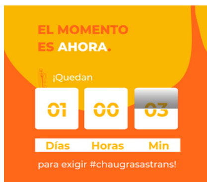
Campaña de comunicación para apoyar Consulta Pública +INFO www.chaugrasastrans.org