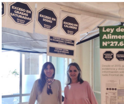
"Congreso Provincial de Salud" en la ciudad de Mar del Plata. +INFO https://bit.ly/FAGRAN-Etiquetado1

El equipo de Etiquetado de FAGRAN sigue trabajando y compartiendo información al colectivo de nutricionistas y a toda la comunidad, en torno al pronto cumplimiento de los plazos de implementación establecidos según la reglamentación de la Ley.