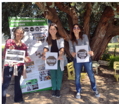
Participación en BIOFERIA junto con Consciente Colectivo y SANAR +INFO https://bit.ly/FAGRAN-Etiquetad2