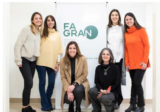
Equipo participando en ReNAEN 2022 llevando información sobre la Ley. +INFO https://bit.ly/FAGRAN-ReNEAN

Desde FAGRAN y SANAR queremos brindar la oportunidad para problematizar y construir de manera colectiva la discusión sobre los Conflictos de Interés en el Ejercicio Profesional. Se presentan tres encuentros de modalidad virtual. +INFO https://bit.ly/FAGRAN-COI