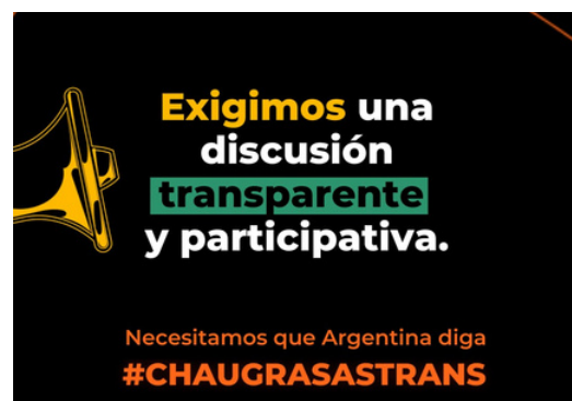
Pedido de transparencia para la próxima reunión de CONAL +INFO https://bit.ly/FAGRAN-CONAL